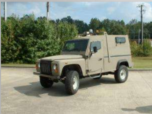
דיפנדר ממוגן "דוד"